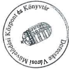
Nádházi- Tálás Csilla